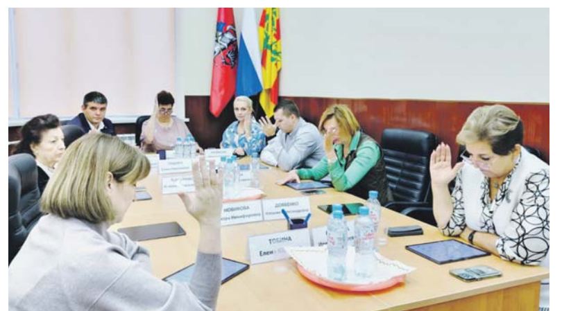
График приема граждан — на стр. 2.

На заседании 21 ноября самым важным вопросом стало рассмотрение графика приема граждан депутатами Совета депутатов муниципального округа Ломоносовский на 2024 год. Депутаты ведут прием не только в здании администрации, но и по месту своей работы. Если вы хотите попасть на прием к депутату, необходимо предварительно записаться по телефону: +7(499)783-84-27 в рабочие дни с 8:00 до 17:00.